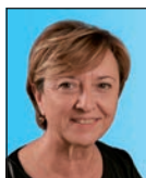
Sylvie BIGAY Députée aux affaires sociales