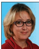
Sidonie KARM Députée à la culture, aux fêtes et aux cérémonies et à la communication