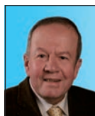
Philippe CHOLET Député aux travaux, à la sécurité des bâtiments publics