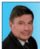
Hervié CAMARD Député à l'urbanisme