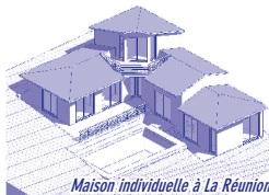
Maison individuelle à La Réunion

25, rue Quincampoix 78580 Maule 01 30 90 60 74 06 07 42 70 84 www.villier-architecte.com villier@club-internet.fr